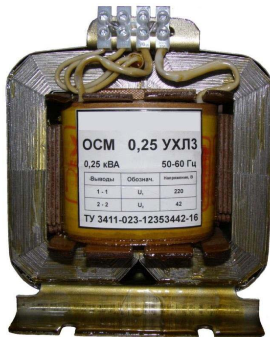
Рис. 1 Общий вид трансформатора.

1.9. Трансформаторы предназначены для монтажа в аппарате (устройстве), у которого защита от прикосновения, попадания воды и перегрузки осуществляется этим аппаратом (устройством).